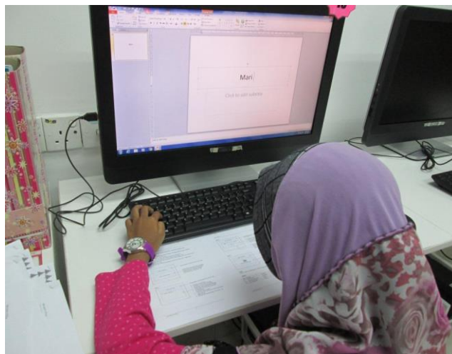
-Kelas Ms Office Power Point 2010- Peserta sedang mengikuti pembelajaran yang diajar oleh petugas.