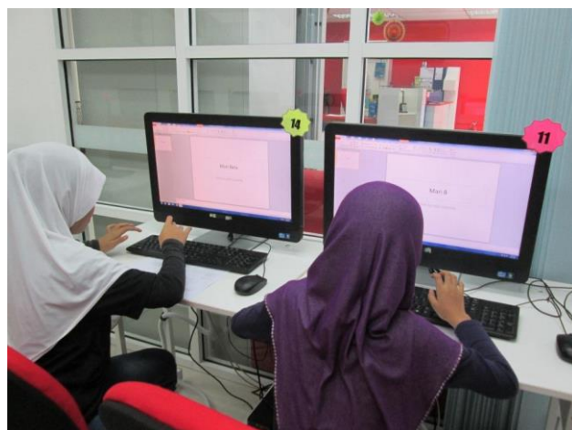
-Kelas Ms Power Point 2010-

Peserta sedang mengikuti pembelajaran yang diajar oleh petugas